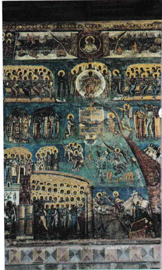
Judecata de Apoi / The Last Judgement

Construite în plan triconc, adaptate pentru îndeplinirea mai multor funcții, inclusiv pe aceea de necropolă domnească, bisericile din Moldova au fost decorate cu splendide picturi interioare și exterioare. Datorită măiestriei compoziției, figurilor însuflețite și eleganței culorilor, în perfectă armonie cu peisajul înconjurător, acestea sunt considerate astăzi apogeul artei medievale românești. Specialiștii sunt de părere că unele teme din programul iconografic se regăsesc doar aici, iar artiștii lor au fost formați la școli de pictură autohtone de mare valoare.