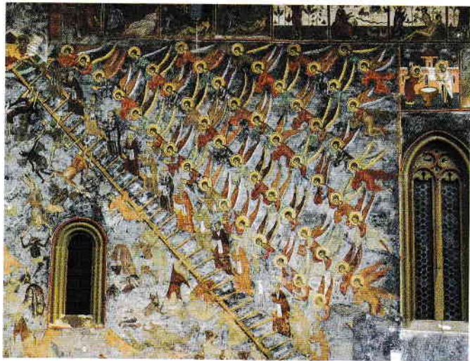
Biserica Învierea Domnului a Mănăstirii Sucevița (1583-1586), cu Scara Virtuțiilor / The Church of the Resurrection, Sucevița Monastery (1583-6), with Ladder of the Virtues

Built on a triconch plan, skilfully adapted to multiple functions, including that of princely tomb, the churches of Moldavia are adorned with spectacular interior and exterior frescoes. Thanks to the majesty of their composition, the vivid figures, and the elegant colours, which are in perfect harmony with the surrounding landscape, the frescoes are today regarded as the apogée of mediaeval Romanian art. Experts are of the opinion that some of the themes in the iconography of the frescoes are to be found only in Moldavia, and the artists were trained in an outstanding native school of mural painting.